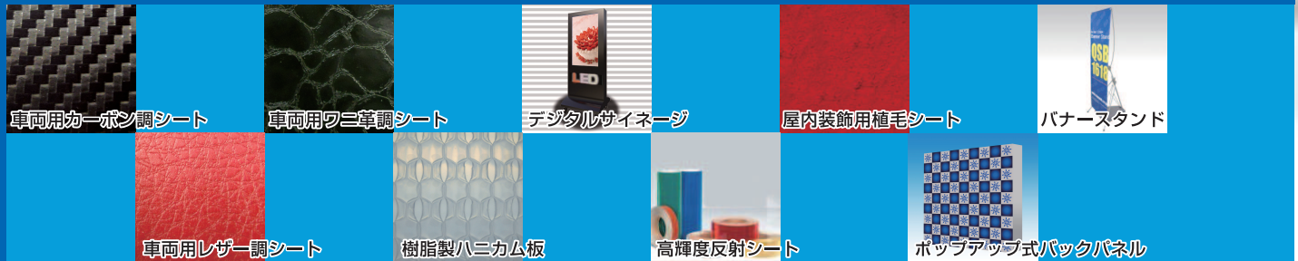
車両用カーボン調シート

業界で関心の高いカーラッピングフィルムやデジタルサイネージ、イベント用グッズまで多数展示。