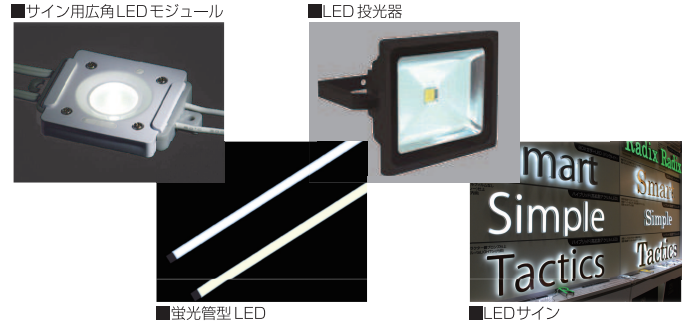
■サイン用広角LEDモジュール

広角165°のサイン用LEDモジュール、蛍光管型LEDやLED投光器など省エネに欠かせないLED製品も各社より展示しております。